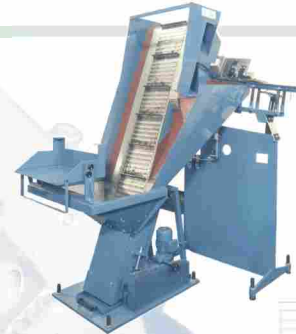
Anwendungen aus der Automobil- und Kunststoffindustrie