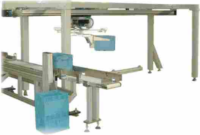
Transportsystem für Kleinladungsträger mit Rose+Krieger Lineareinheit DuoLine Z zur Bestückung eines Paternosters