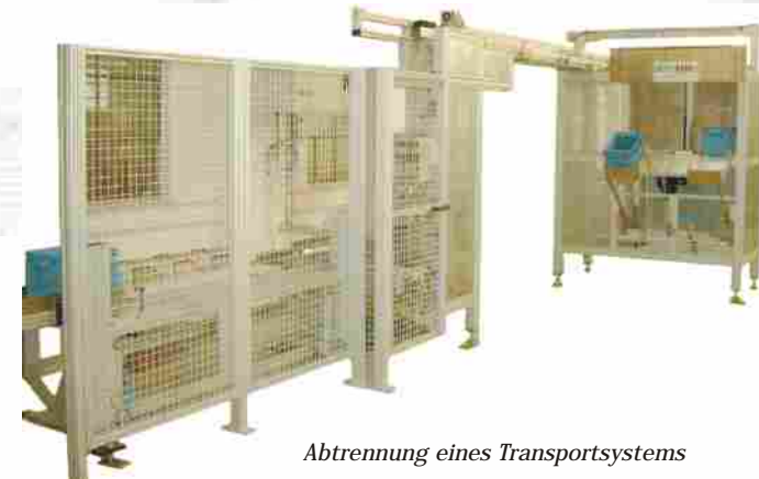
Abtrennung eines Transportsystems