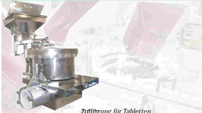
Zuführung für Tabletten