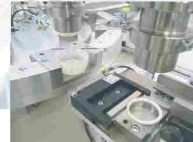
Montage- Rundschaftautomat für Deckel