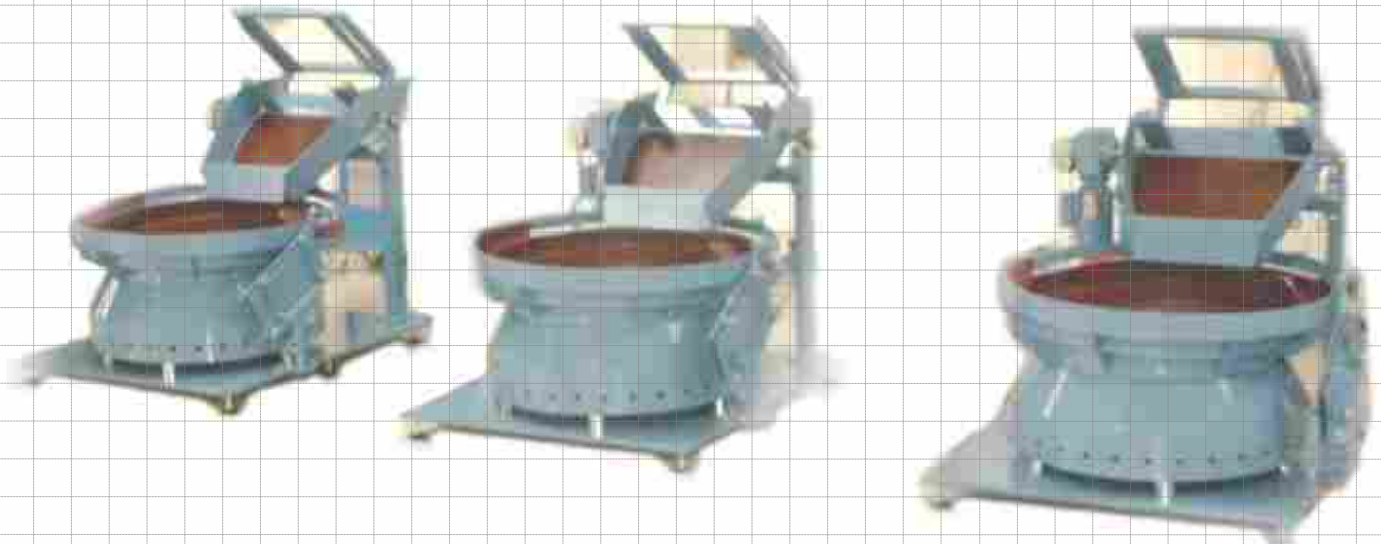
Wendelgleitförderer mit Behälterentleervorrichtung