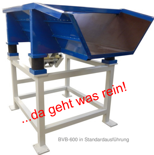
BVB-600 in Standardausführung

von 350 bis 750 Liter Nettovolumen - Da geht was rein!!!