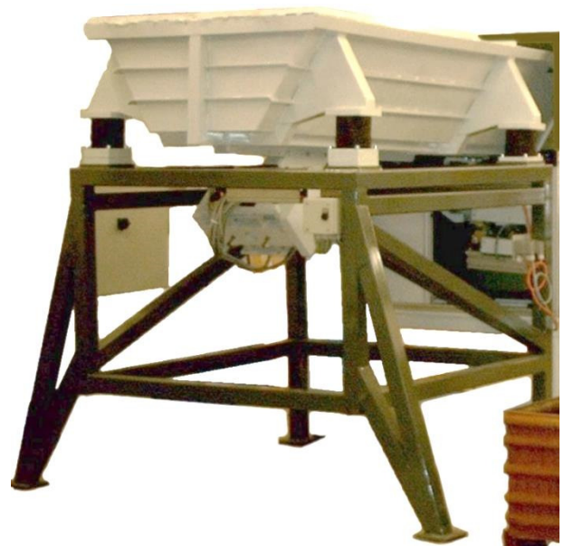
Beispielfoto zeigt BVB-750 mit Sonder-Untergestell